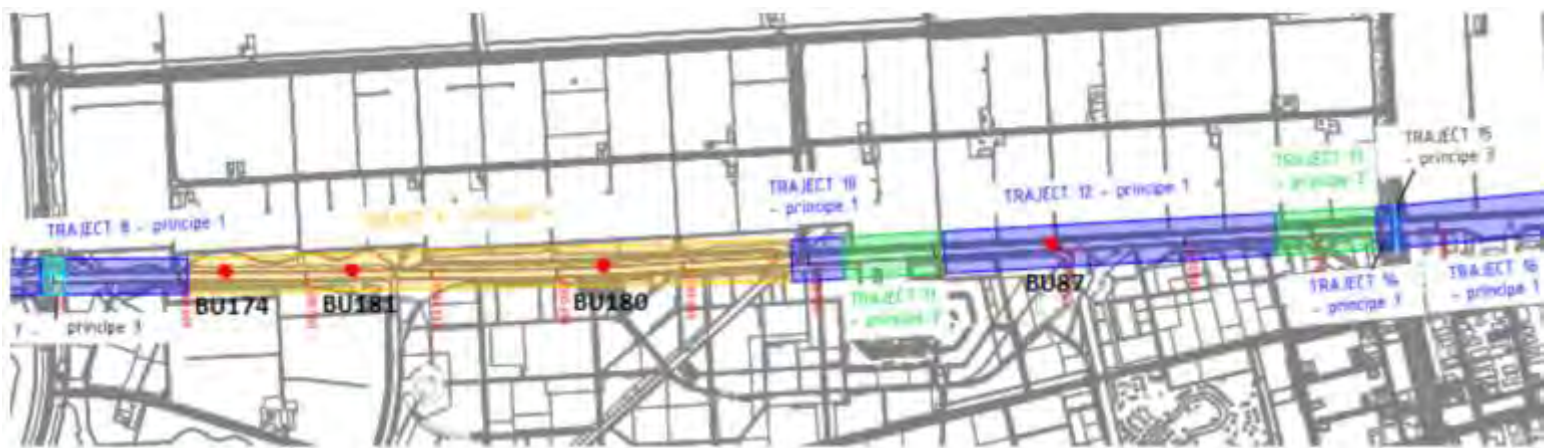
Figuur 3, trajecten en burchten