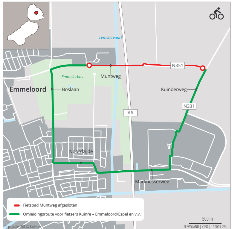
Kaart 1: omleidingsroute

Het bospad tussen de Marknesserweg en het viaduct A6 loopt tijdens de werkzaamheden dood; vanuit het Emmelerbos is de aansluiting naar het fietspad langs de Muntweg dicht (zie kaart 2).