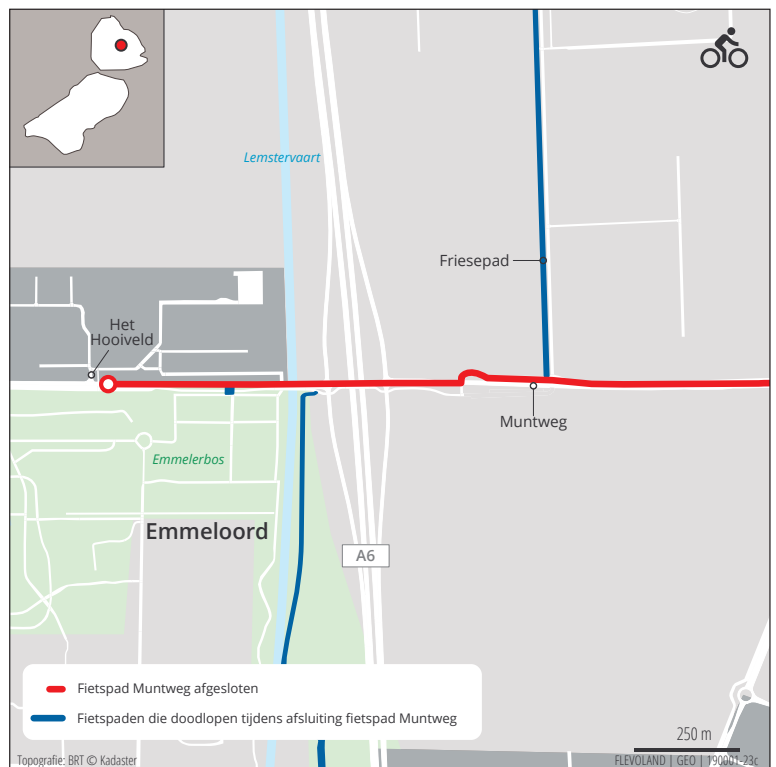
Kaart 2: fietspaden die doodlopen