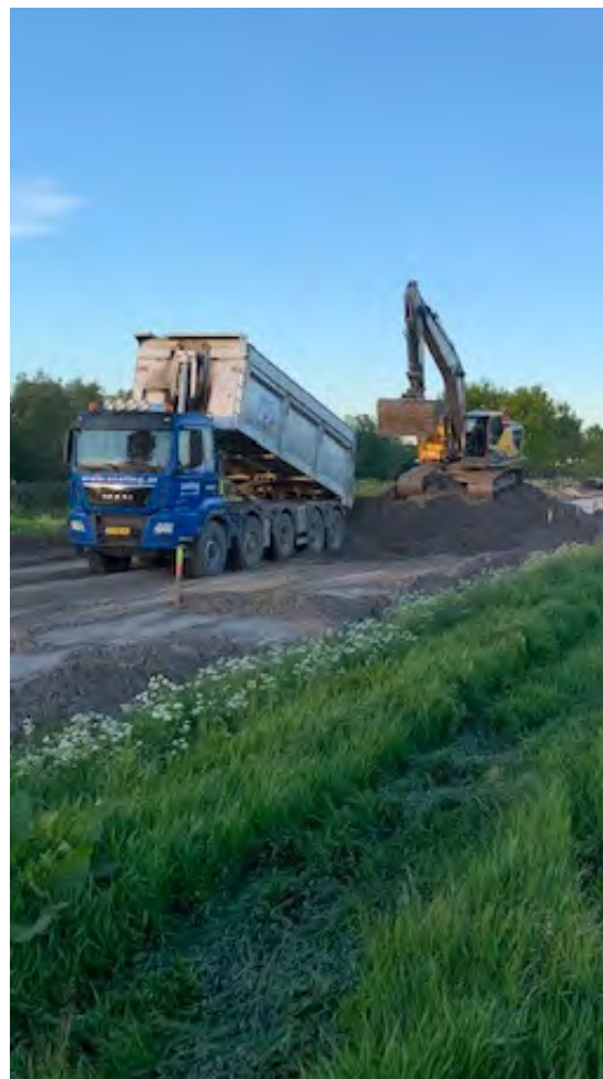
De voorbelasting wordt aangebracht.

De aangebrachte voorbelasting blijft tenminste één jaar liggen. Maandelijks meet De Waard de voortgang. Uit deze metingen bleek dat er op een aantal plekken van het nieuwe traject extra voorbelasting nodig was. Hier stroomde vroeger de Oereem en daardoor zit de ondergrond net anders in elkaar. Op deze plekken zijn extra maatregelen getroffen.