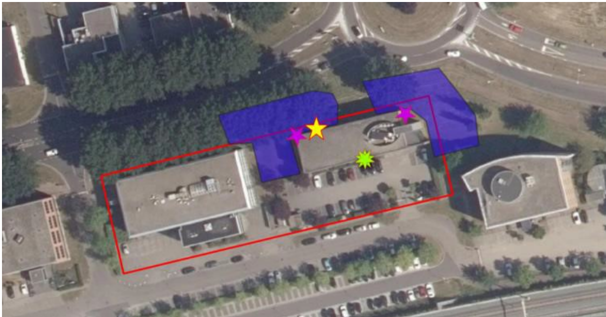
Overzicht huidige verblijfplaatsen