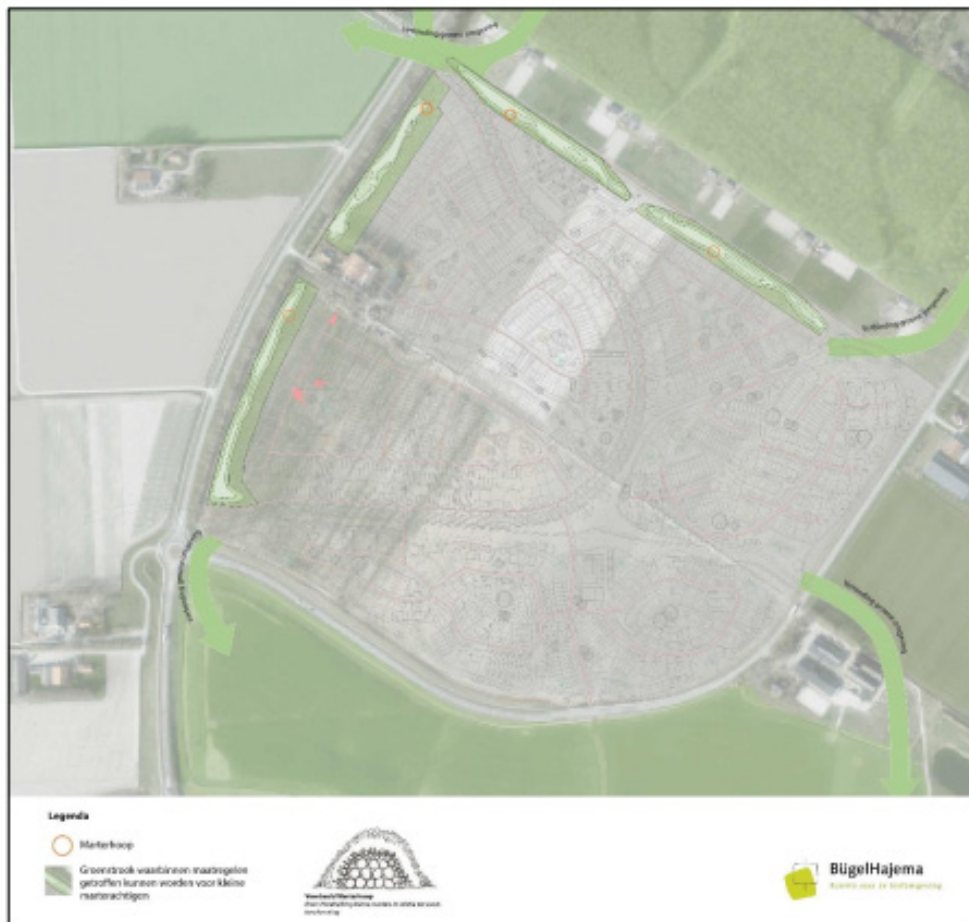
Figuur 2. Maatregelenkaart kleine marterachtigen

Er worden vier groenstroken met voldoende dekking voor kleine marters aangelegd, in elke groenstrook komt ook een takkenhoop met een marterkast. Over of onder de weg komt een verbinding?