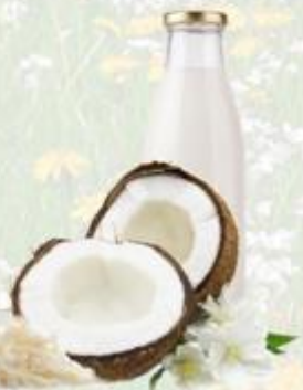
Plantaardige alternatieven voor zuivel