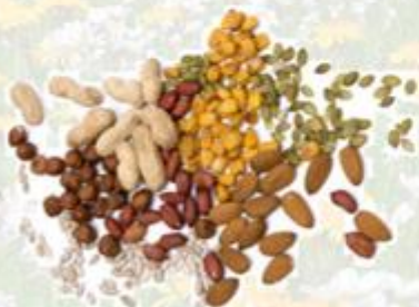
Noten, zaden, pitten