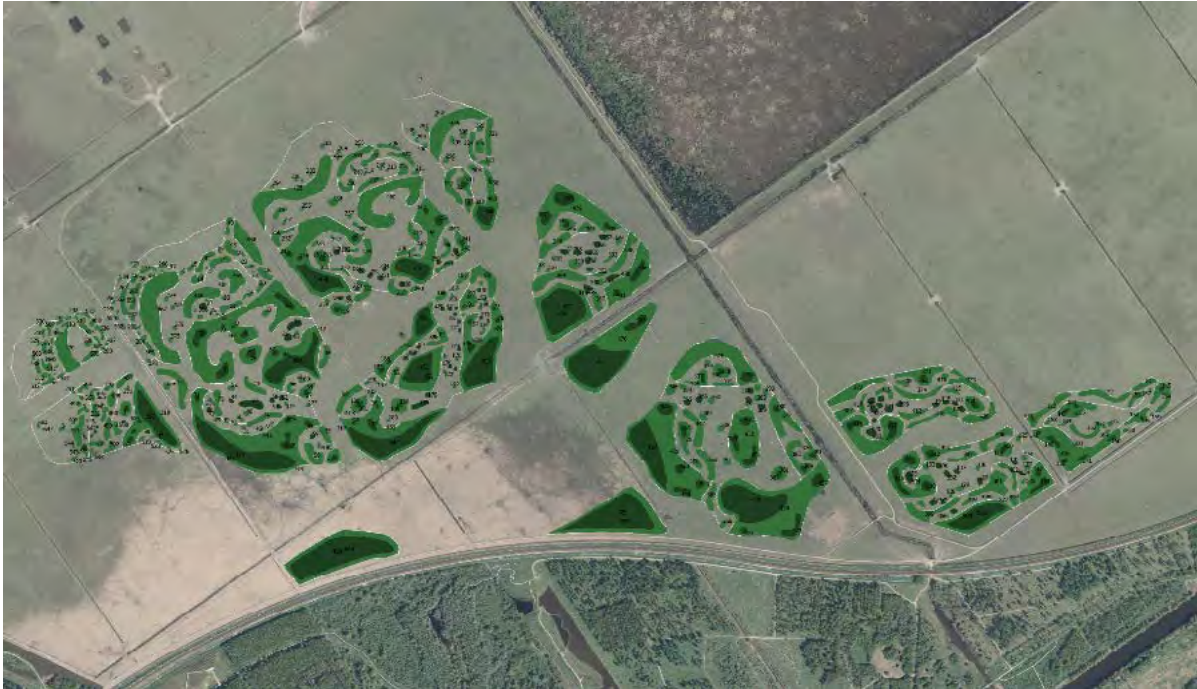
Figuur 2 Te beplanten delen binnen de uitgerasterde delen op het Stort en in de Beemdlanden. Donkergroen boomvormers, licht groen struweel

Tot het moment dat de aanplant voldoende beschutting biedt, stelt de omliggende gebieden open. Dit gebeurt mede, omdat de voorziene beschutting in de Oostvaardersplassen in de aankomende jaren nog niet de gewenste beschutting, zoals hiervoor benoemd. Tot dat moment wil Staatsbosbeheer voldoende beschuttingsmogelijkheden voor de dieren bieden. Het eind mei 2020 vastgestelde managementplan van Staatsbosbeheer schrijft over de openstelling van de omliggende bossen: "... delen van het Oostvaardersbos en het Kotterbos, en de Driehoek in zijn geheel, [zijn] opengesteld als beschuttingsgebied voor grote herbivoren. Voor edelherten zijn deze gebieden jaarrond toegankelijk, voor runderen en paarden zijn delen alleen in de winter toegankelijk. Deze gebieden worden tot nu toe in de winterperiode afgesloten voor recreanten om grote herbivoren rust te bieden".