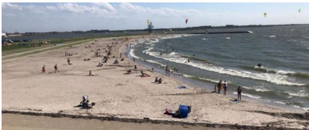
Figuur 2: 'Bataviastrand' in Lelystad waar verschillende doelgroepen samenkomen.

Het Bataviastrand is een mogelijke zwemplek die zich bevindt aan de kust van Lelystad in het Markermeer. Dit strand is in gebruik genomen als watersportstrand, en dit is tot en met 2022 ook zo aan de burgers gecommuniceerd. Met het prachtige weer van de afgelopen seizoenen maken ook zwemmers gebruik van dit strand. In de zomer komen er gevaarlijke situaties voor wanneer zwemmers en kitters op het strand kruisen. Ervaringen vanuit de afgelopen jaren, samen met ervaringen vanuit andere regio's van het land, wijzen erop dat het in de praktijk niet haalbaar zal zijn om zwemmers op deze locatie te weren. Het is namelijk een schitterend strand dat voldoet aan een aanzienlijke vraag.