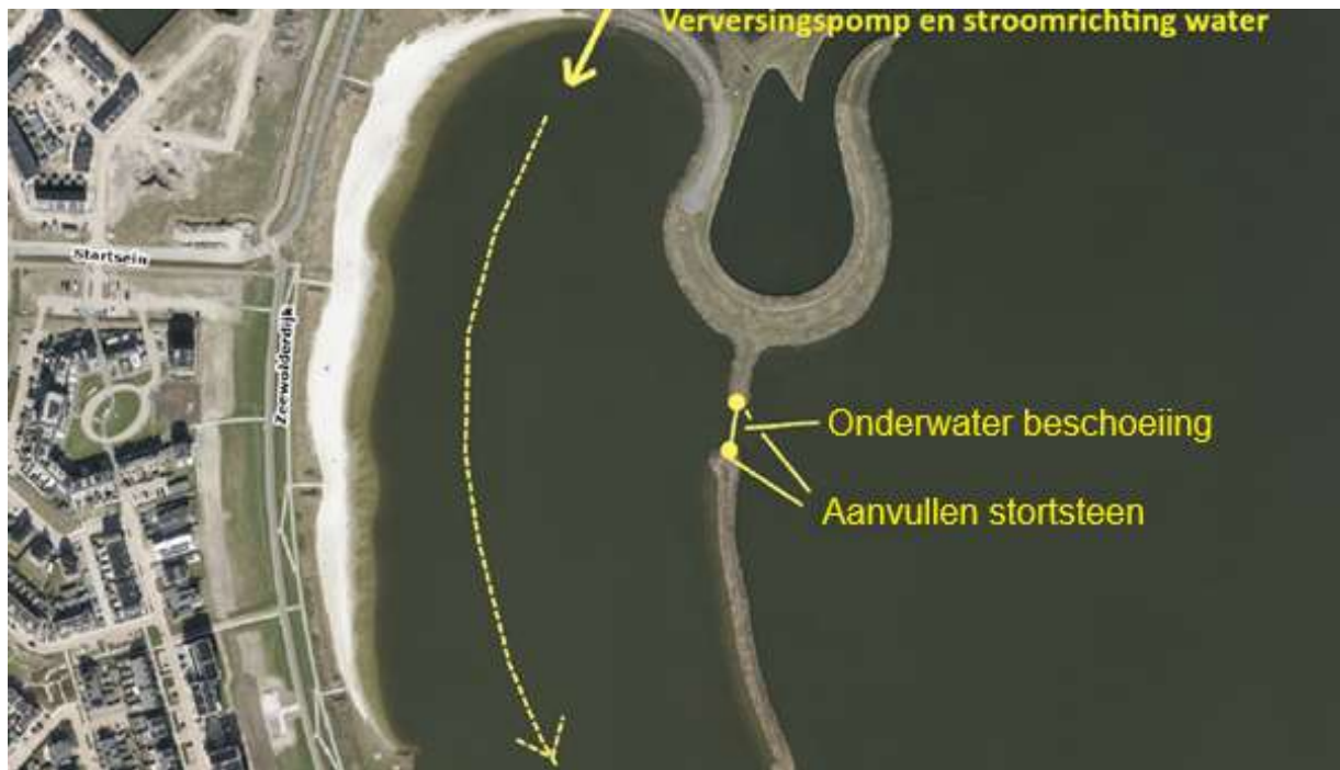
Figuur 1: Luchtfoto van 'het Landerstrand', met aanduidingen voor de verversingspomp, de onderwaterbeschoeiing en het aanvullen met stortstenen.