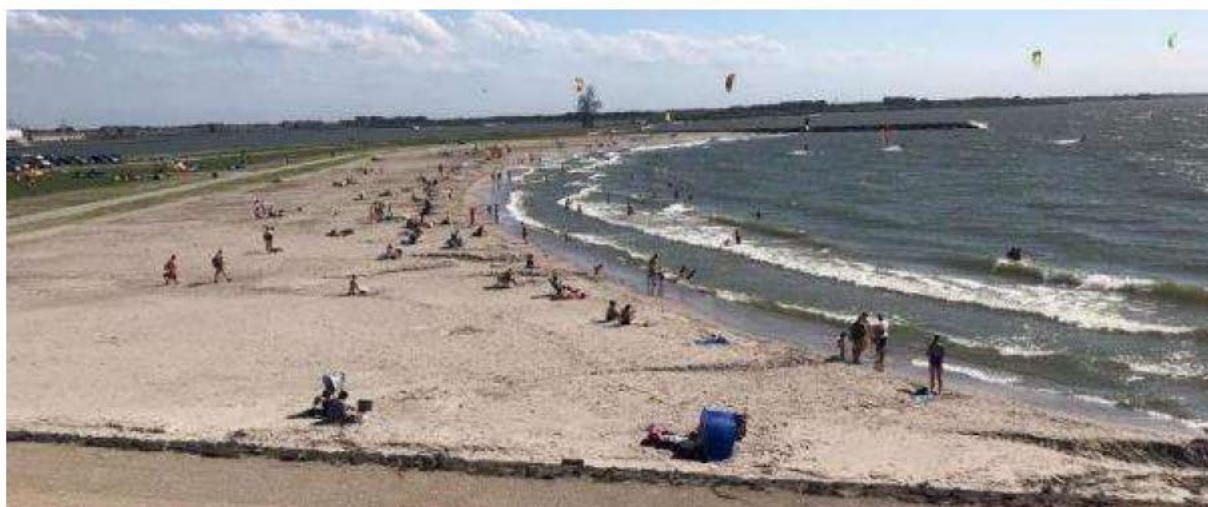
Figuur 2: 'Bataviastrand' in Lelystad waar verschillende doelgroepen samenkomen.

Het Bataviastrand is een mogelijke zwemplek die zich bevindt aan de kust van Lelystad in het Markermeer. Dit strand is in gebruik genomen als watersportstrand, en dit is tot en met 2022 ook zo aan de burgers gecommuniceerd. Met het prachtige weer van de afgelopen seizoenen maken ook zwemmers gebruik van dit strand. In de zomer komen er gevaarlijke situaties voor wanneer zwemmers en kitters op het strand kruisen. Ervaringen vanuit de afgelopen jaren, samen met ervaringen vanuit andere regio's van het land, wijzen erop dat het in de praktijk niet haalbaar zal zijn om zwemmers op deze locatie te weren. Het is namelijk een schitterend strand dat voldoet aan een aanzienlijke vraag.