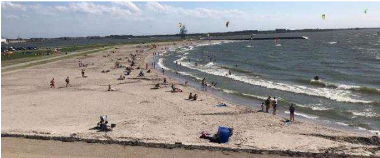
Figuur 2: 'Bataviastrand' in Lelystad waar verschillende doelgroepen samenkomen.

Het Bataviastrand is een mogelijke zwemplek die zich bevindt aan de kust van Lelystad in het Markermeer. Dit strand is in gebruik genomen als watersportstrand, en dit is tot en met 2022 ook zo aan de burgers gecommuniceerd. Met het prachtige weer van de afgelopen seizoenen maken ook zwemmers gebruik van dit strand. In de zomer komen er gevaarlijke situaties voor wanneer zwemmers en kitters op het strand kruisen. Ervaringen vanuit de afgelopen jaren, samen met ervaringen vanuit andere regio's van het land, wijzen erop dat het in de praktijk niet haalbaar zal zijn om zwemmers op deze locatie te weren. Het is namelijk een schitterend strand dat voldoet aan een aanzienlijke vraag.