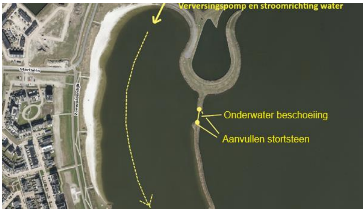
Figuur 1: Luchtfoto van 'het Landerstrand', met aanduidingen voor de verversingspomp, de onderwaterbeschoeiing en het aanvullen met stortstenen.