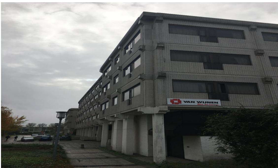
Foto 2. Het pand aan de Maerlant 12 te Lelystad.