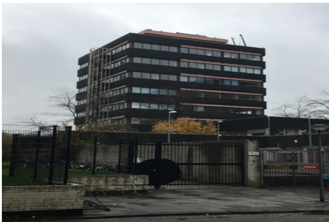
Foto 1. Het pand aan de Maerlant 8 te Lelystad. Met name dit pand herbergt potentiële verblijfplaatsen voor vleermuizen.