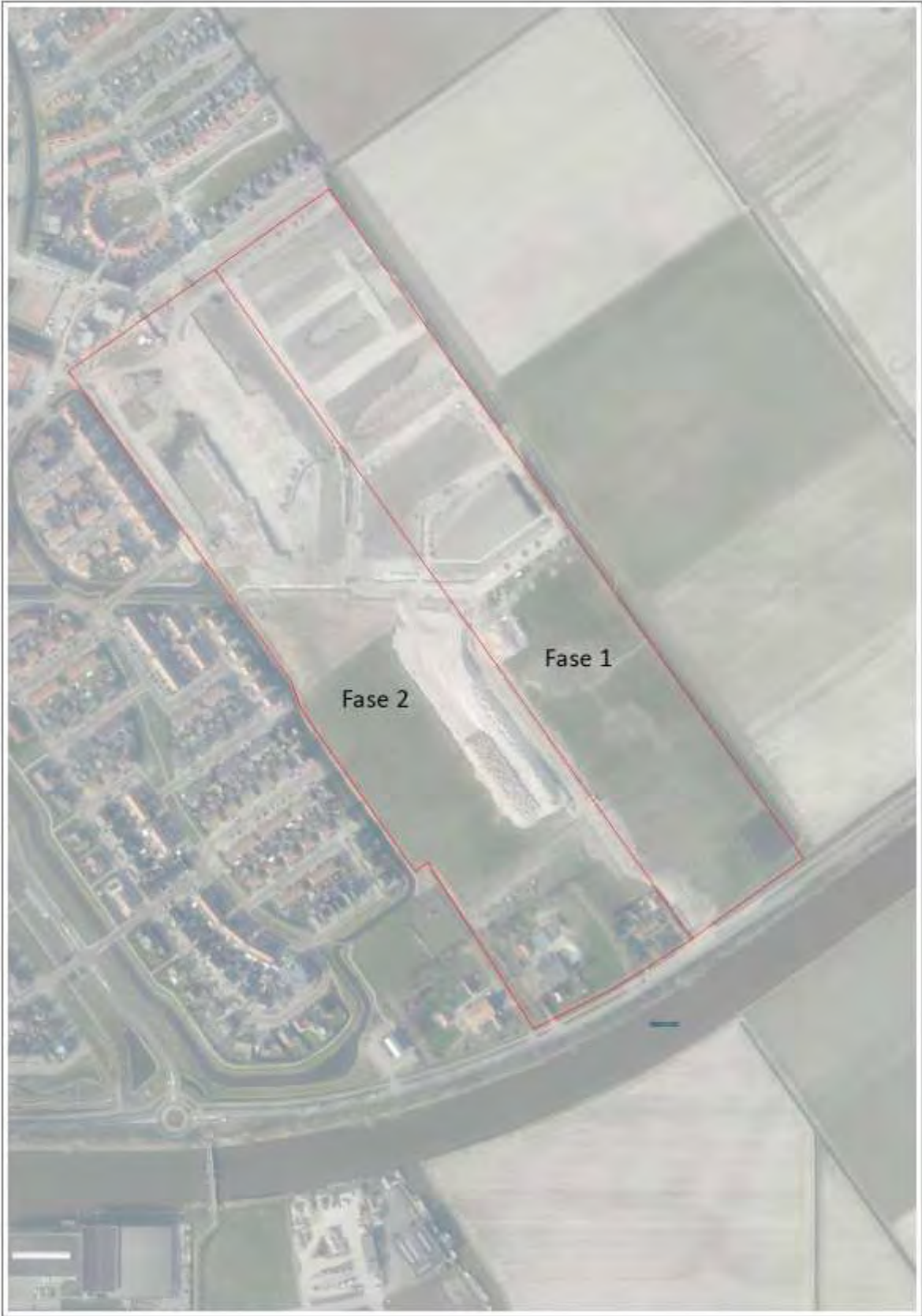
Bijlage 2: Locatie bestemmingsplangebied (fase 1 en 2).