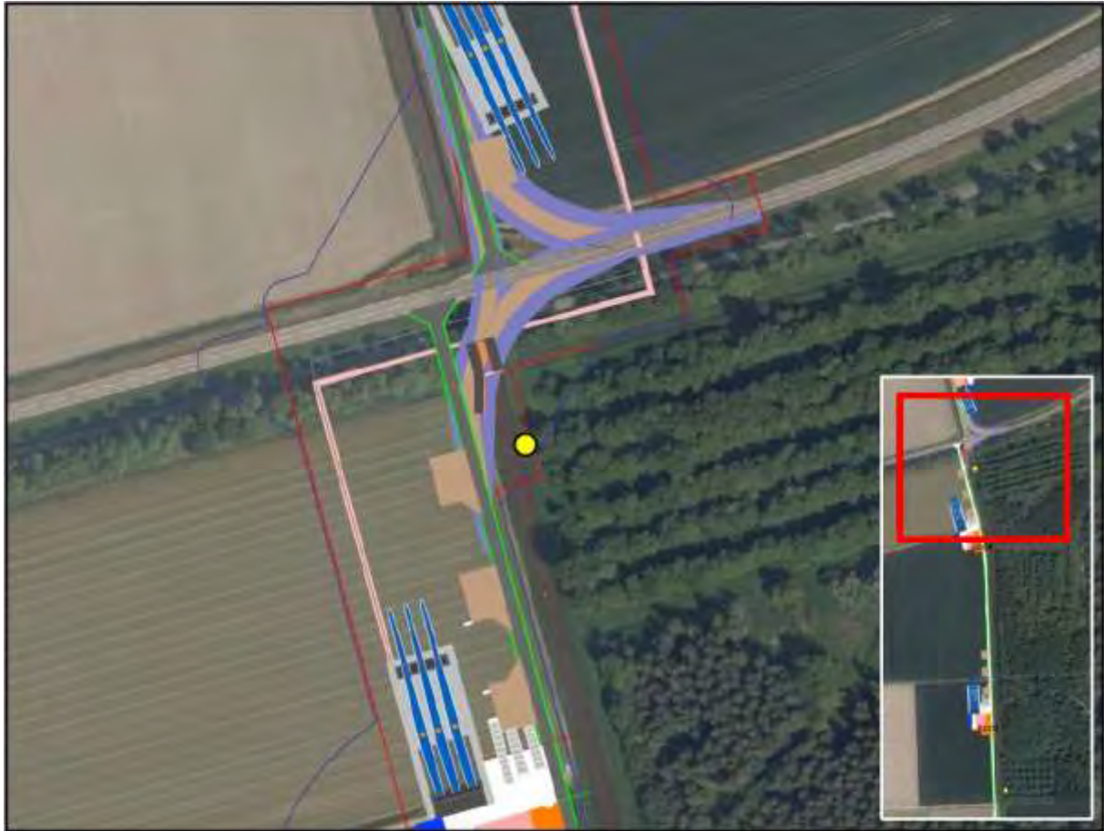
Parkweg en overkluizing nabij beverburcht