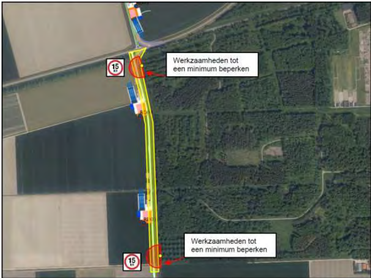
Maatregelen bij beverburchten