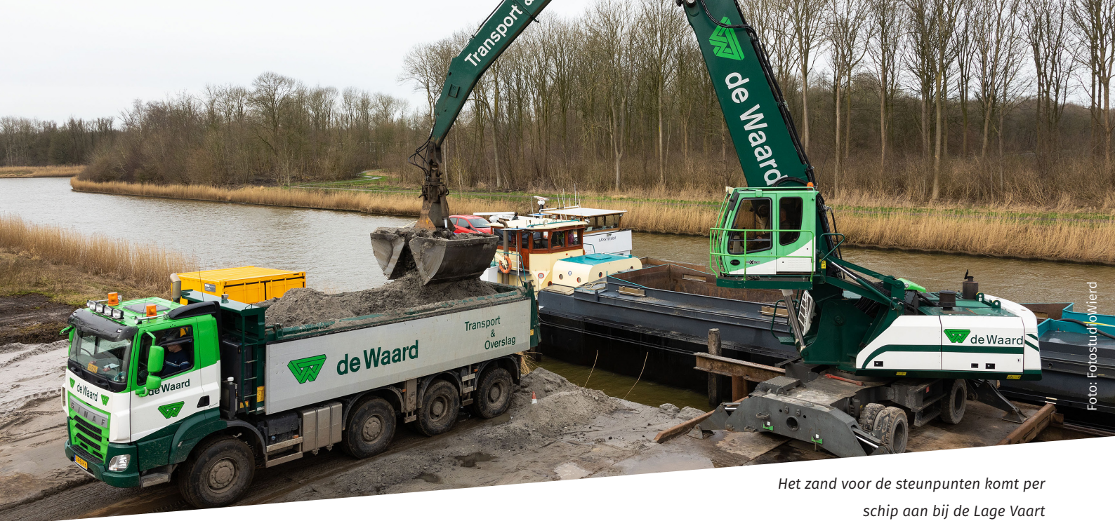
Het zand voor de steunpunten komt per schip aan bij de Lage Vaart