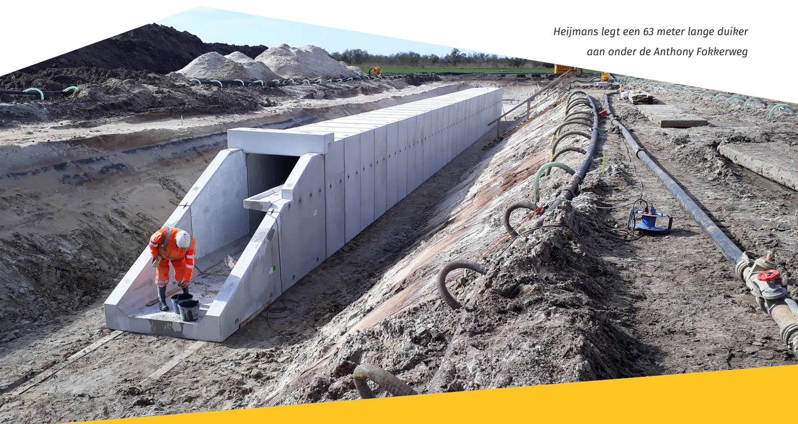
Heijmans legt een 63 meter lange duiker aan onder de Anthony Fokkerweg

maximum snelheid van 70 km/uur. Verkeer over de A6 moet in die periode rekening houden met een extra reistijd van zo'n 10 tot 30 minuten. Vanwege de maatregelen rondom het COVID-19 Coronavirus kan de extra reistijd ook minder zijn dan 10 minuten. Daarnaast werkt Heijmans zo efficiënt mogelijk door verschillende werkzaamheden te combineren, zodat de beperking zo kort mogelijk duurt..