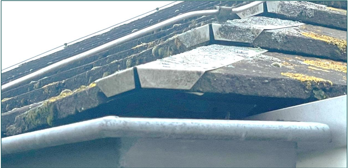
Figuur 3.2 Impressie van de platte daktegels die geen ruimte bieden voor huismussen of gierzwaluwen om gebruik te maken met de dakruimte.

Er is wat betreft vogels met jaarrond beschermde nesten geen sprake van het vangen of doden van individuen, het wegnemen van rust- of nestplaatsen, of het wegnemen van structuren die essentieel zijn in het functioneren van rust- of nestplaatsen.