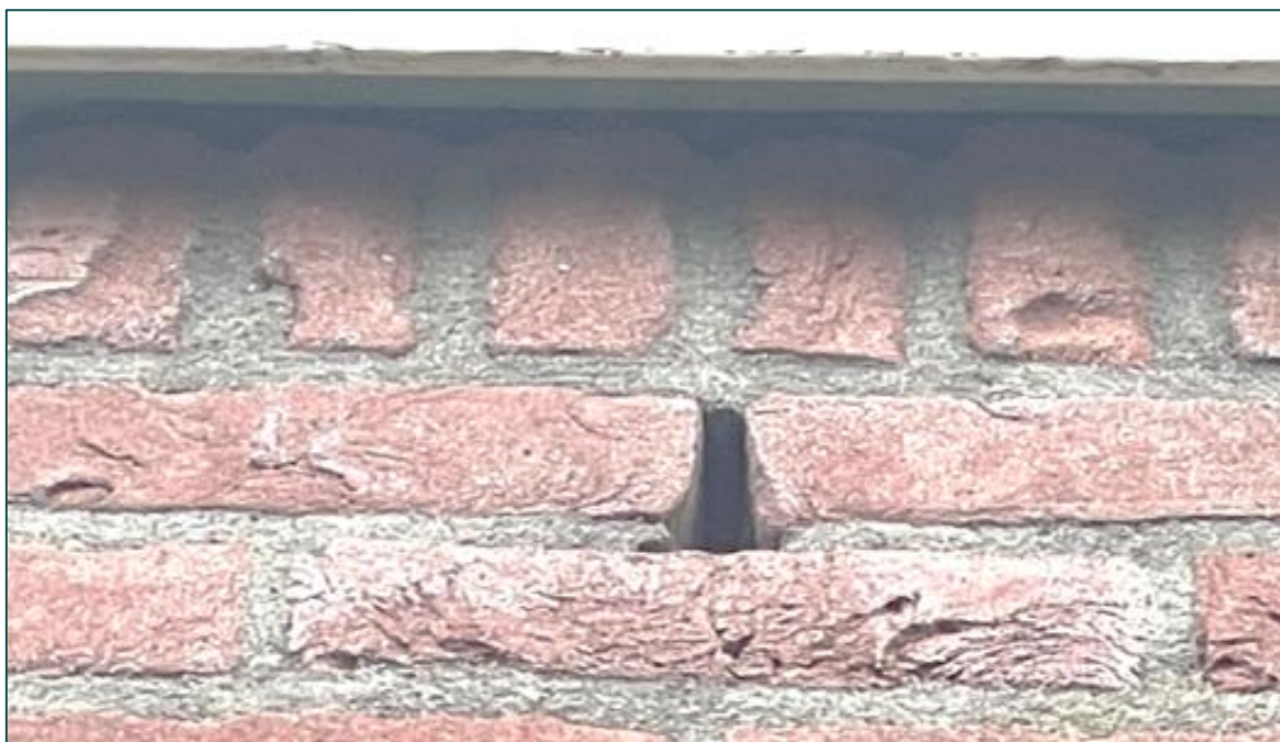
Figuur 3.1 Impressie van potentiële invliegopeningen en verblijfplaatsen voor vleermuizen in het te renoveren of te slopen gebouw.

Om aan- of afwezigheid van vleermuizen vast te stellen dient aanvullend onderzoek plaats te vinden middels veldbezoeken in de periode april-september (zie H5.3 ).