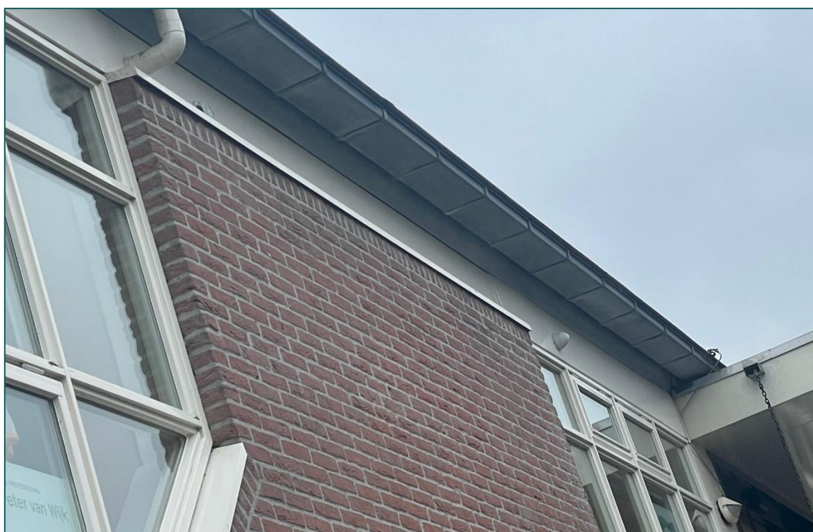
Figuur 2 Impressie van de gevels waaruit de bebouwing opgebouwd is.