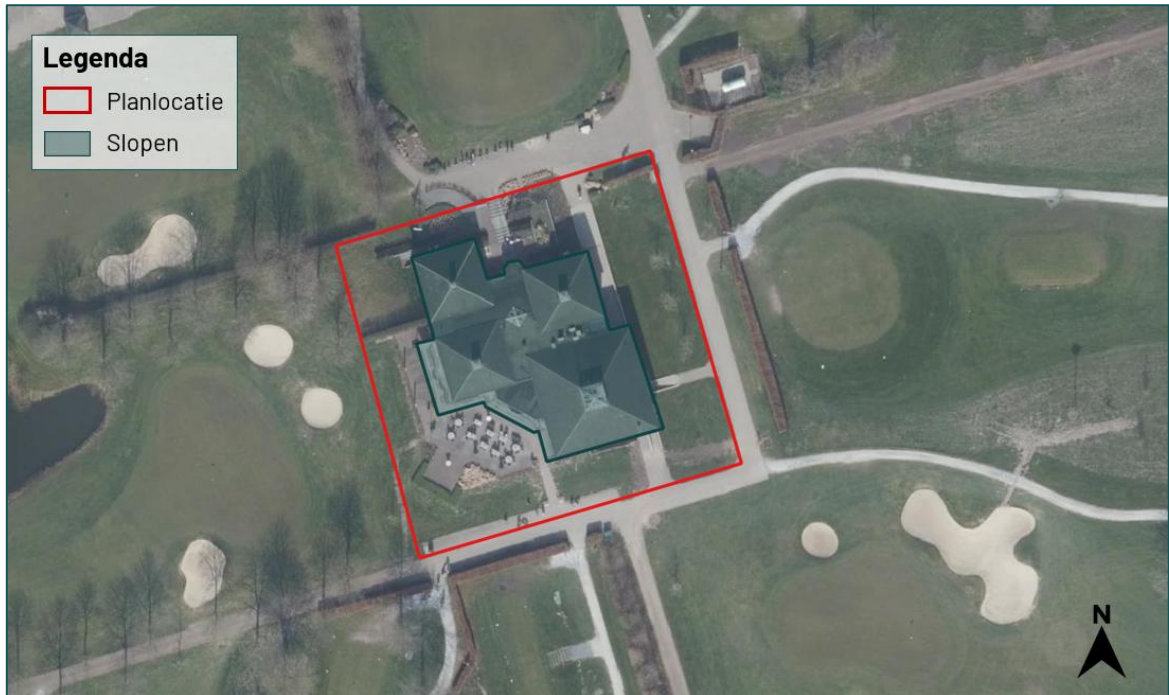
Figuur 1.2 De planlocatie (rood omkaderd) is gelegen aan de Golfbaan 1 te Zeewolde.

De planlocatie is gelegen aan de Golfbaan 1 te Zeewolde (figuur 1.2). De bebouwing is opgetrokken uit 4 vierkante gebouwen aaneengesloten in het midden doormiddel van een plat dak. De gebouwen zijn allemaal opgebouwd uit een gemetselde muur met spouw en gedeeltelijk open stootvoegen. De 4 gebouwen bevatten tentdaken met platte daktegels en de overgang van de gevel naar het dak is afgewerkt met boeiborden en daktrimmen. De bebouwing wordt aan vier kanten omringd door golfterreinen die gesitueerd is aan de rand van het bos Horsterwold. In figuur 1.3 en bijlage 1 zijn een aantal foto's opgenomen die een impressie geven van de planlocatie en de directe omgeving hiervan.