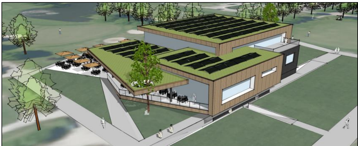
Figuur 1.5 Visuele representatie van de mogelijk beoogde situatie.