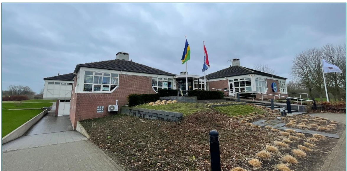
Figuur 1.3 Op de planlocatie is men voornemens om de bebouwing grootschalig te verbouwen of volledig te slopen.

De directe omgeving van de planlocatie wordt gekenmerkt door het bos Horsterwold aan de noord-, zuid- en westzijde en aan de oostzijde het dorp Zeewolde. Circa 2,1 km ten noordwesten loopt de N305 en circa 3 km ten oosten bevindt zich het meer Wolderwijd.