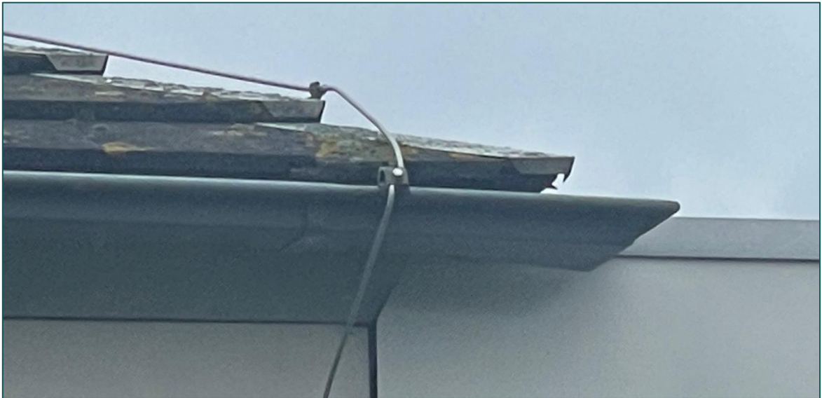
Figuur 3 Impressie van de platte daktegels waaruit het dak van de bebouwing opgebouwd is.