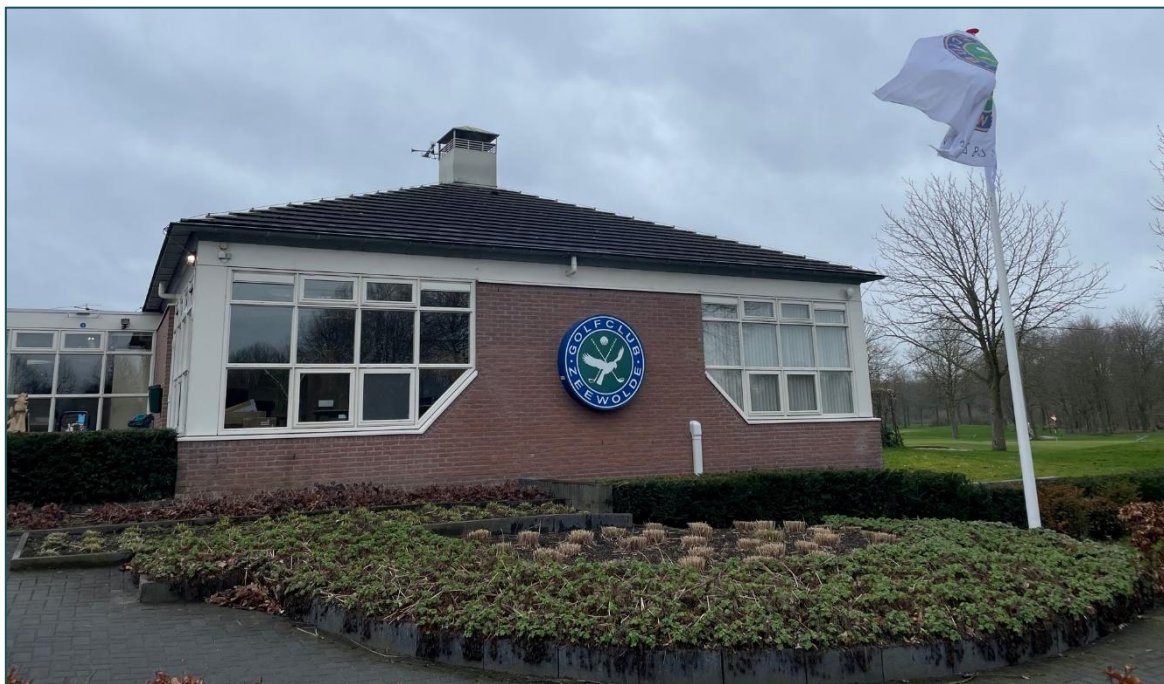
Figuur 1.1 De planlocatie is gelegen aan de Golfaan 1 te Zeewolde.