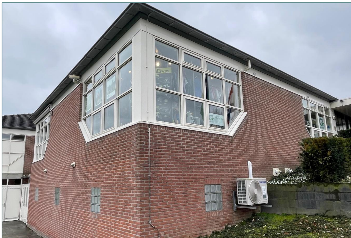
Figuur 1 De planlocatie is gelegen aan de Golfiaan 1 te Zeewolde en bestaat uit het gebouw van een Golfclub.