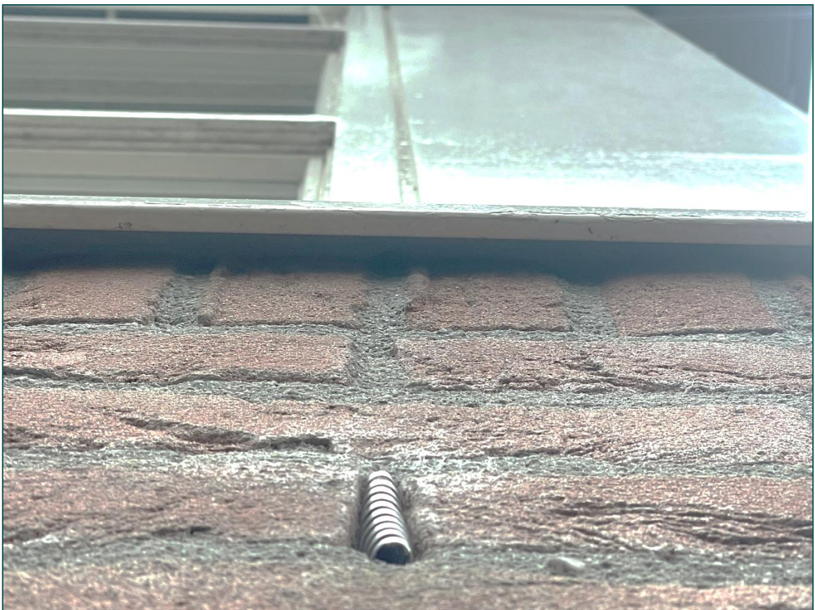
Figuur 4 Impressie van een deel van de stootvoegen die door middel van bijenbekjes afgesloten zijn.