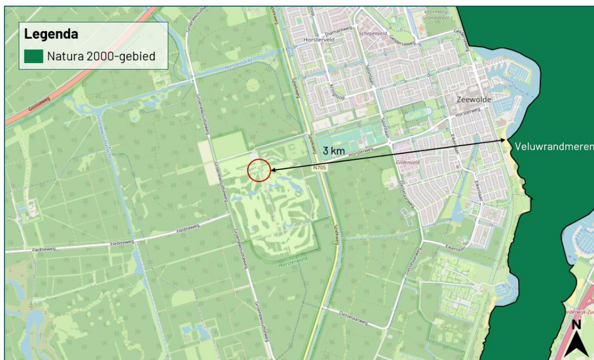
Figuur 3.3 De planlocatie ligt op een afstand van circa 3 km tot het Natura 2000-gebied 'Veluwrandmeren'.

De planlocatie maakt geen deel uit van een Natura 2000-gebied. Op een afstand van circa 3 km ligt het Natura 2000-gebied 'Veluwrandmeren' (figuur 3.3).