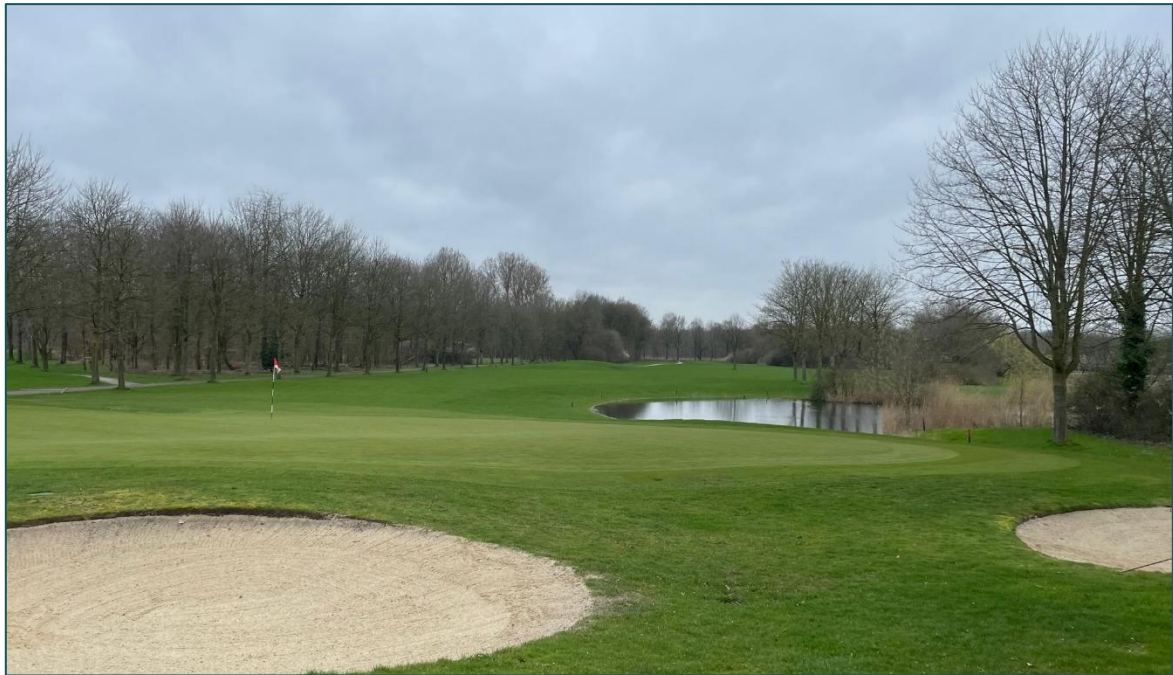
Figuur 1.4 Fotografische indruk van de omgeving van de planlocatie.