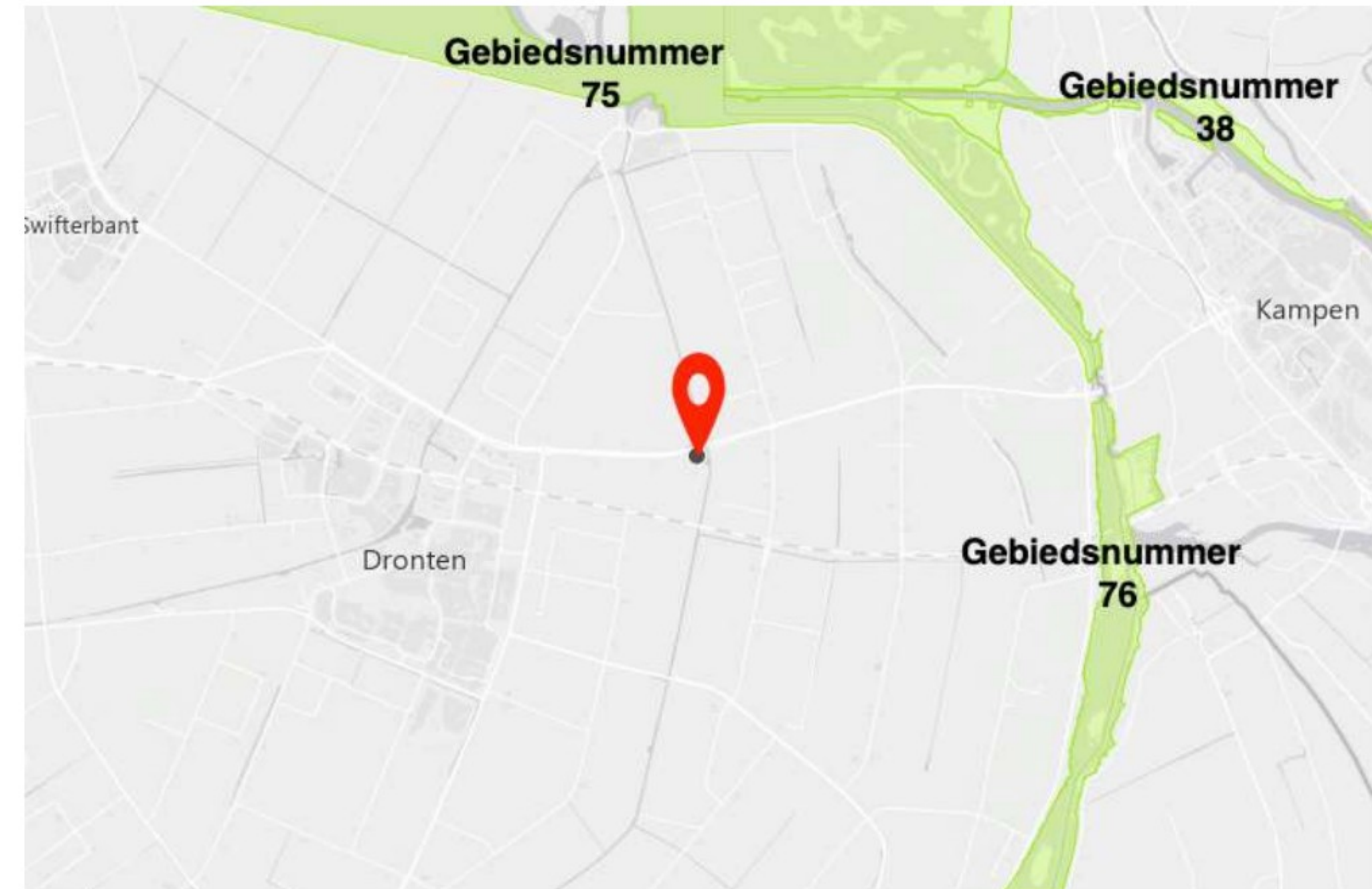
Afbeelding 3. Locatie plangebied (rood) N2000 (groen)