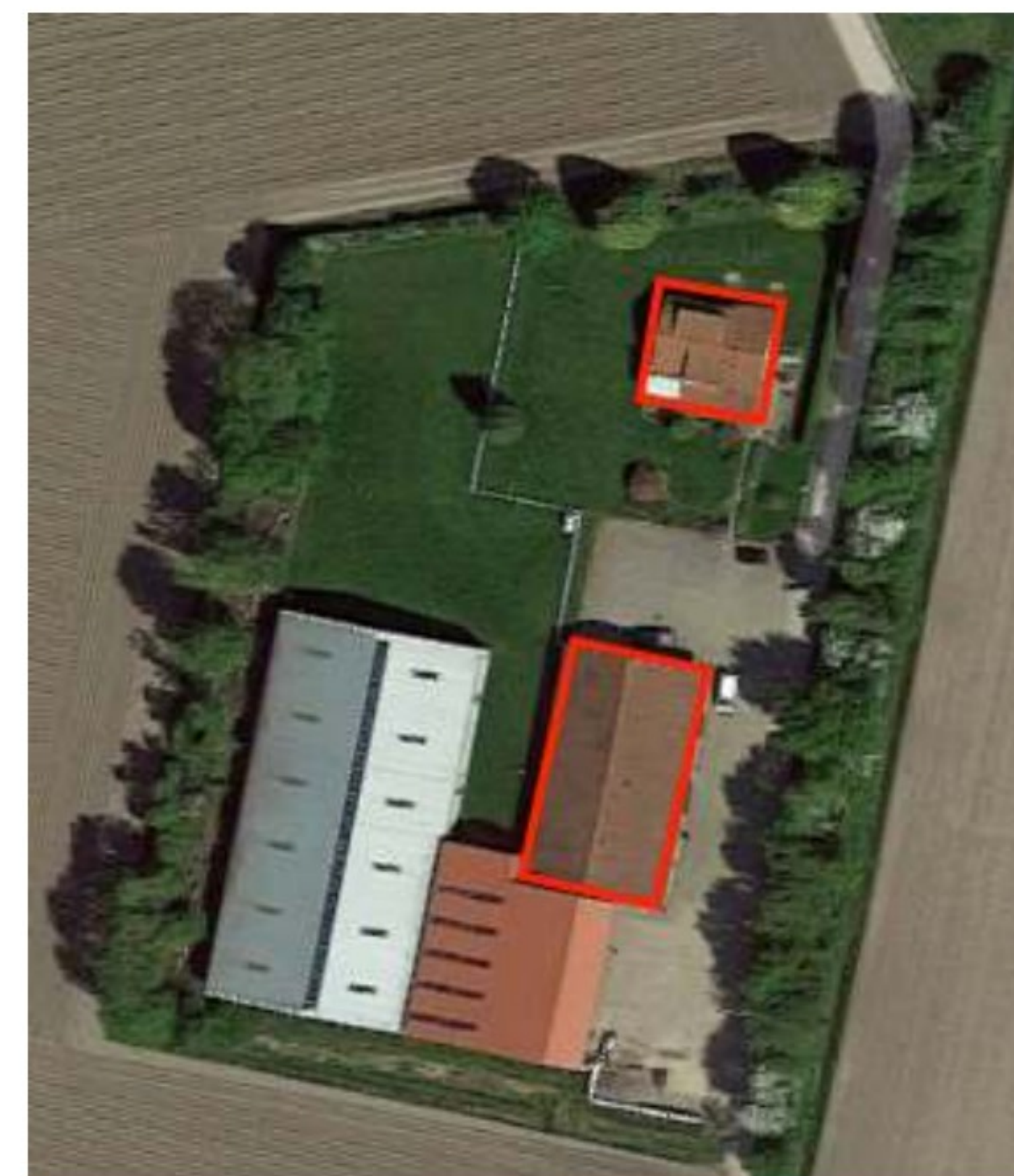
Afbeelding 1&2. Locatie plangebied (rood)