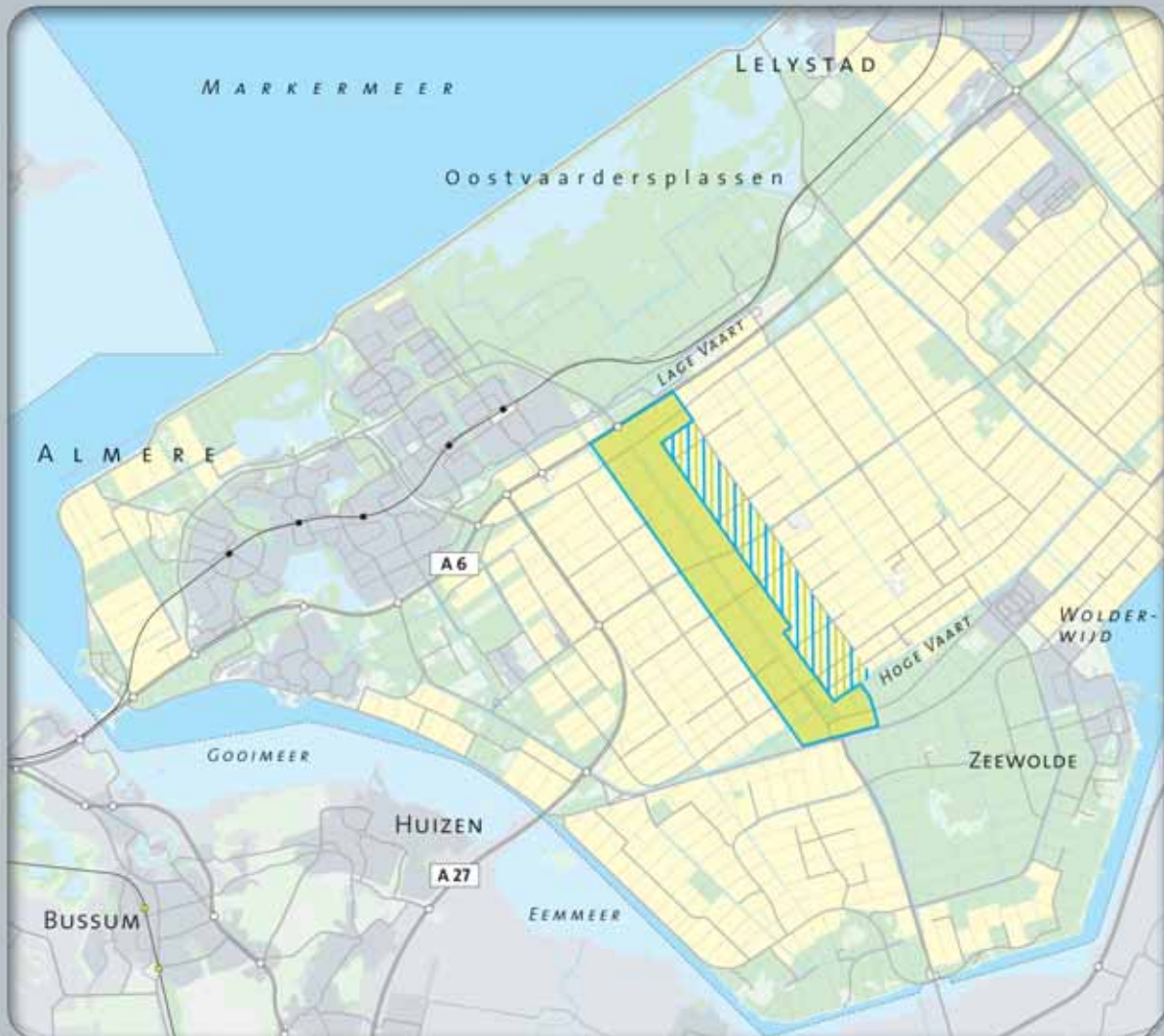
FIGUUR 25 GROEN-BLAUWE ZONE OOSTVAARDERSWOLD