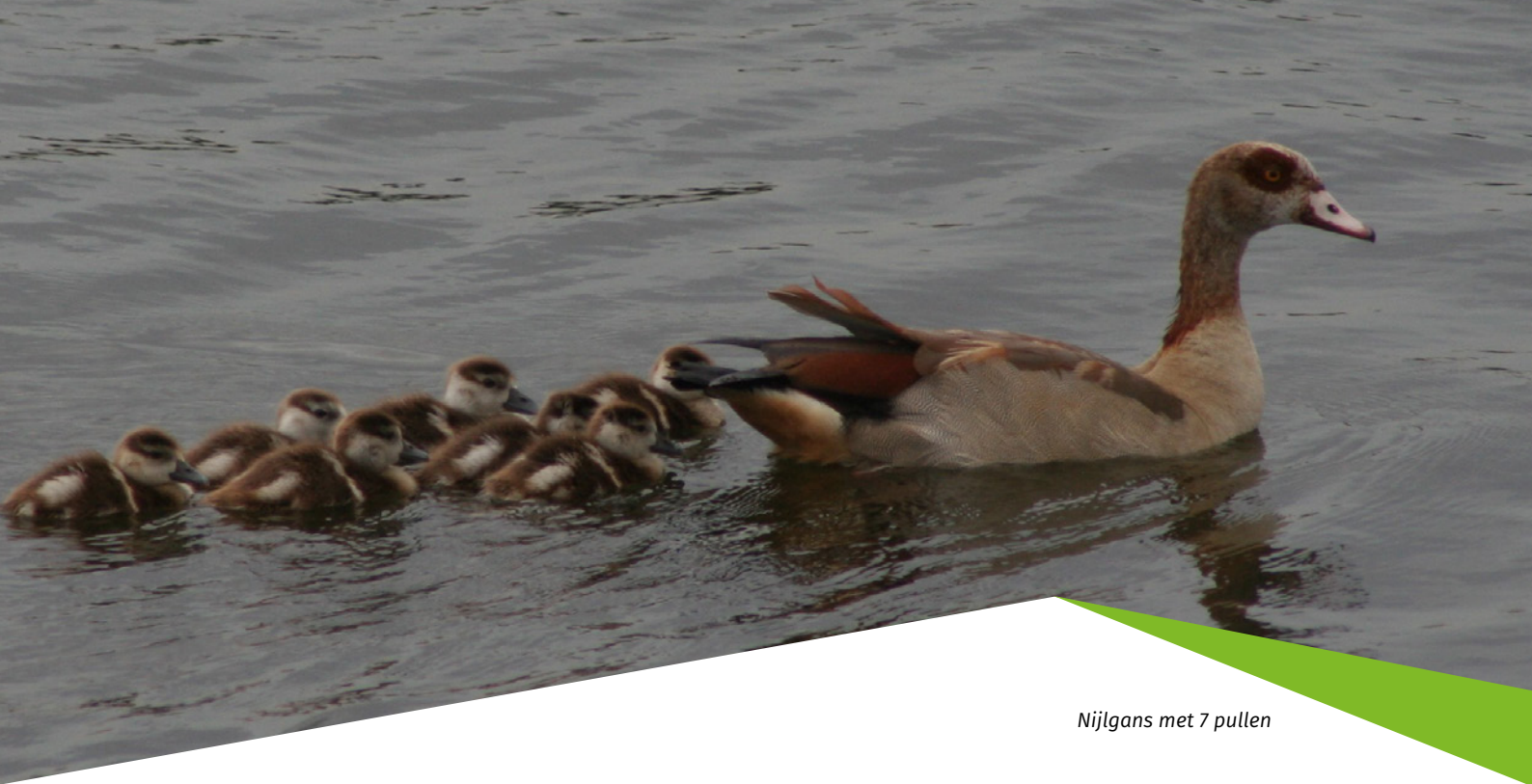
Nijlgans met 7 pullen