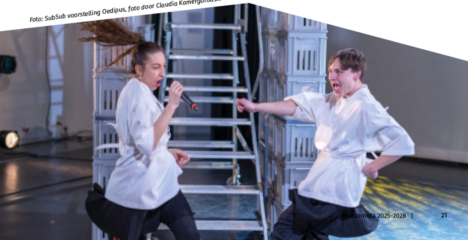
Foto: SubSub voorstelling Oedipus