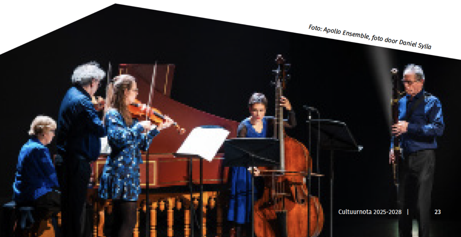
Foto: Apollo Ensemble