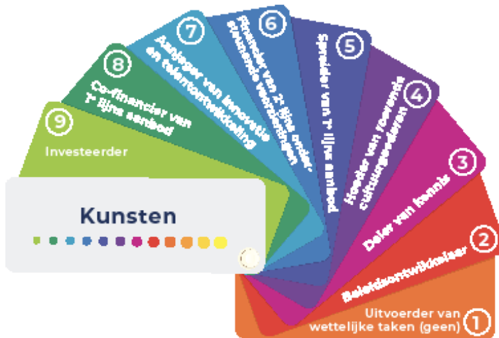
Figuur 1. Waaier met provinciale rollen op het terrein van de kunsten (ontwikkeld door adviesbureau Berenschot).