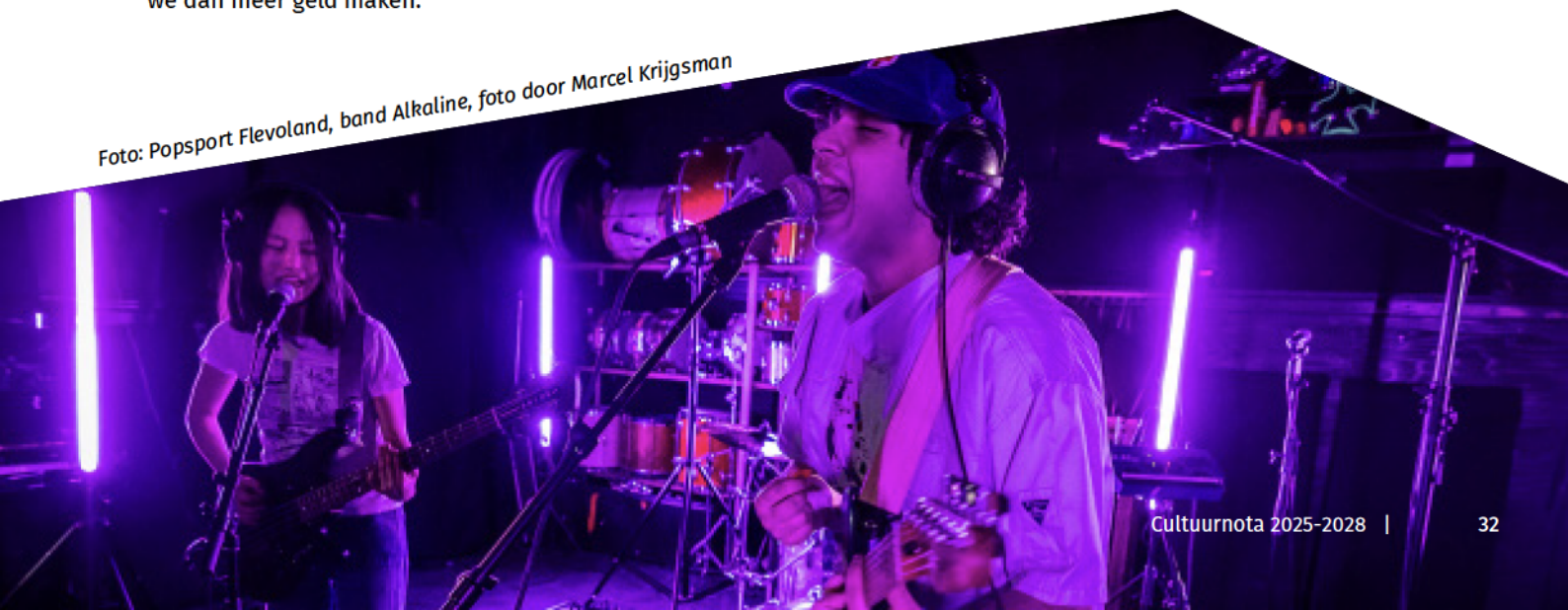
Foto: Popsport Flevoland, band Alkaline, foto door Marcel Krijgsman

Hierbij is alleen sprake van uitbreiding van de wettelijke taak van de provincie op het gebied van bibliotheken. Daarnaast wordt bij professionele podiumkunst het budget geactualiseerd in lijn met de groei van de bevolking. Met dit scenario blijft Flevoland flink achterlopen op cultureel gebied.