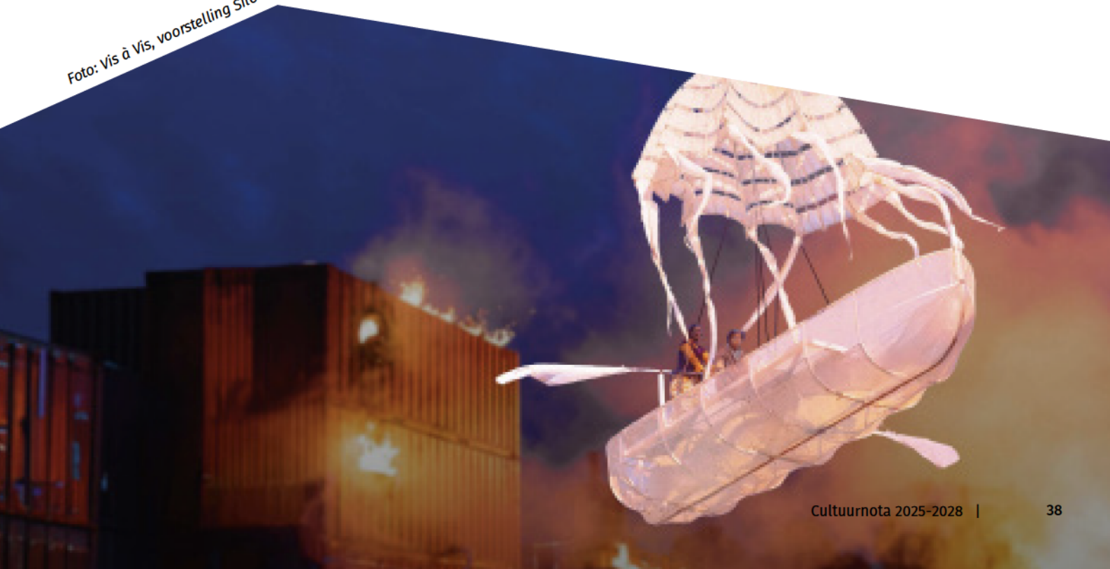
voorstelling Silo 8

Voormalig staatssecretaris mw. Uslu heeft in haar Meerjarenbrief 2025-2028 aangegeven duidelijke meerwaarde in de cultuurregio's te zien, de samenwerking te willen voortzetten en daarbij blijvend aandacht te geven aan onderwerpen waarop het rijk en de andere overheden elkaar versterken.