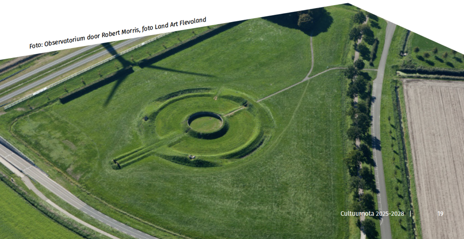
Foto: Observatorium door Robert Morris