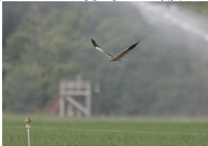
Figuur 8 Grauwe kiekendief percelen Barkema

De natuurcompensatieverplichtingen bestaan uit kiekendief-fourageergebied, bos en moeras. De 3 soorten kiekendieven die al jagen op het land van Ben en Armgard Barkema, zullen een beter habitat worden aangeboden en er naar verwachting blijven jagen. Met de aanleg van kiekendief stroken en kruidenrijke graslanden nemen de muizen en insecten, en dus de kiekendieven toe. Mogelijk kunnen deze oppervlakten een rol spelen als compensatie voor verloren gegaan gebied. In de pijplijn staan ook de plaatsing van een aantal hele grote windmolens. Het is niet ondenkbaar dat de plaatsing van deze reuzen langs het Natura 2000 gebied IJsselmeer, en in het Rivierduingebied de wens tot aanleg van Natuurcompensatie oproept. Met de start van een natuurboerderij kan aan deze wens tot compensatie worden voldaan en kan hoeve G38 wellicht een bijdrage leveren aan de opschaling en inpassing van windmolens in Flevoland.