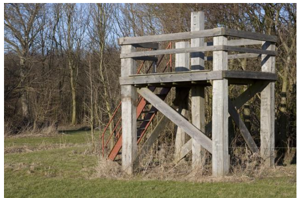
Figuur 3 Replica van een meetstoel

Achterop, langs de bosrand worden kleinschalige akkers ingericht. Hier is over het land van de Barkema's een wandelroute gepland. Vanuit de replica van de meetstoel langs het Klokbekerbos is het fraaie landschap al goed te overzien. Een duizenden jaren oud kreekrestant is zichtbaar gemaakt in het landschap. Het wandelpad zal verder worden uitgebreid langs het gehele bedrijf, meer dan een kilometer lang! Halverwege zal een informatiebord worden geplaatst met de bijzonderheden van die plek zoals de vogels, het beheer, maar ook aardkundige waarden. Vanaf het pad kunnen wandelaars de vochtige kreek weerspiegeld zien in het landschap en genieten van de vogels, de natuurlijk bloeiende weides en de ouderwetse koeien. Wetenswaardig is dat de zichtbare kreekbedding het naastgelegen archeologisch reservaat ondersteunt en versterkt. Bezoekers krijgen zo een prachtig beeld van de Swifterbant-cultuur en de rijke historie van het Rivierduingebied. Het aantal bezoekers aan het gebied zal toenemen waardoor het draagvlak voor landbouw in de regio verder zal worden versterkt. De wandelroute gaat verder naar de Klokbekeweg. Vandaar zal de route langs de nevenkavel, naar de Visvijverweg lopen. De kavel daar, G37, wordt naast weiland als kruiden- en faunarijke akkerperceel ingericht. Langs de Klokbekeweg komen bloemen en bloem-plukstroken: naast bijen zullen veel fietsers met een rijke bloemenoogst weer naar huis terug keren!