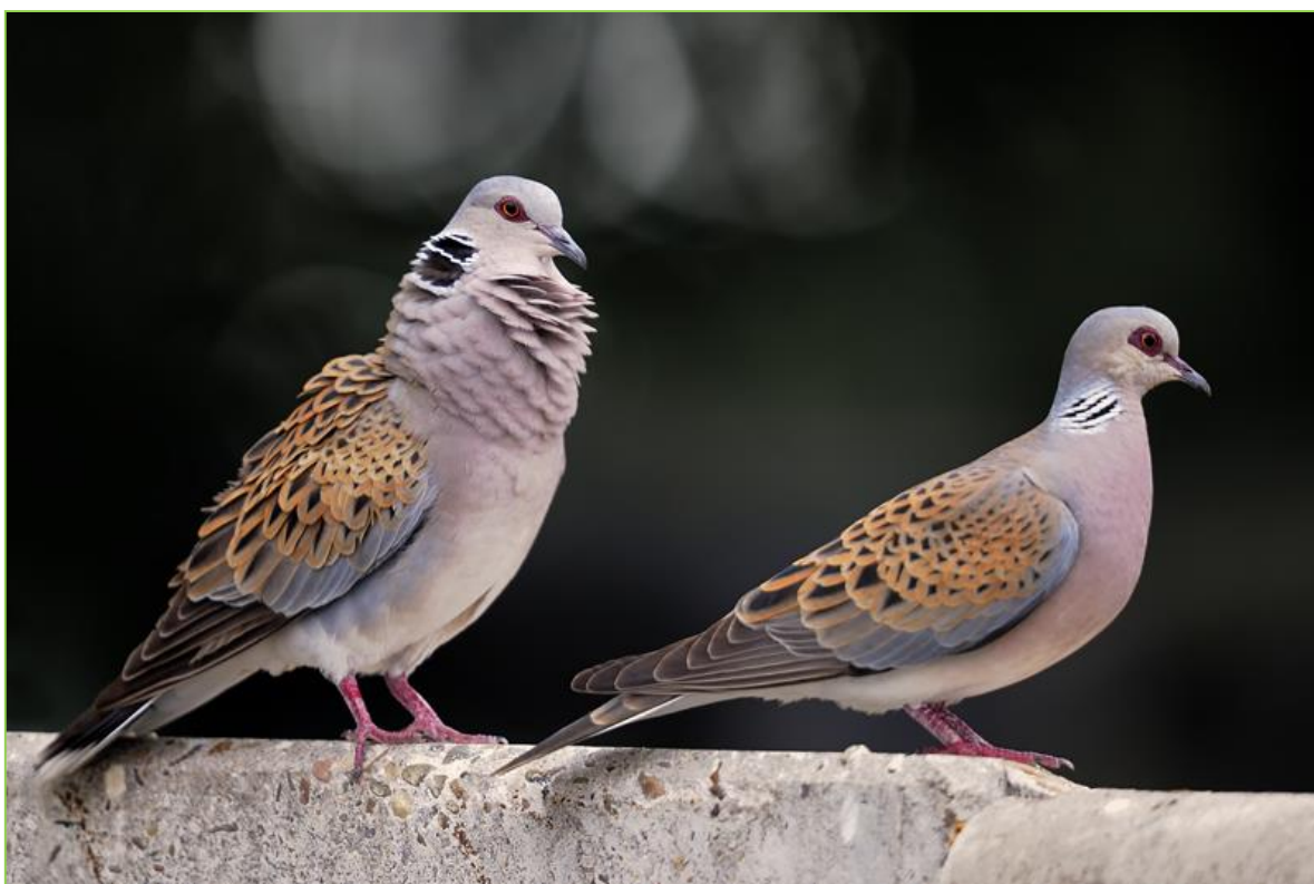
Figuur 7 Zomertortel op erf van Hoeve G38

Nederland kent een internationale verantwoordelijkheid ten aanzien van haar rode lijstsoorten. Tientallen kwamen al op de boerderij voor (zie bijlage) . Aan de doelsoorten van de provincie, veldleeuwerik, graspieper , zomertortel en grauwe kiekendief is altijd al bijzondere aandacht besteedt onder de voorgestelde bedrijfsvoering. Maar nu lopen de aantallen terug.