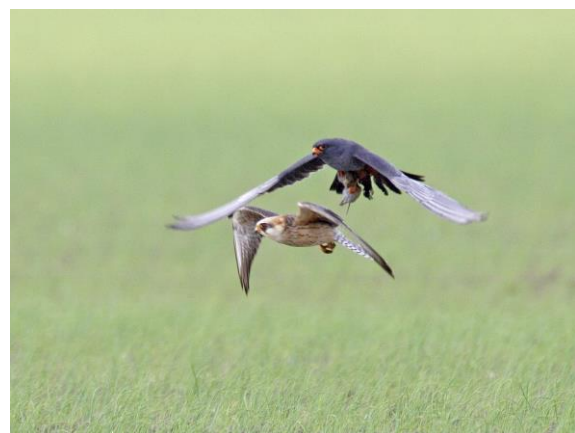
Figuur 5 Paar Roodpootvalk op land Barkema

Rivierduingebied worden de aantallen van vroeger bij lange na niet gehaald. Ook op het land van de Barkema s is het rustiger geworden met de vogels: het is tijd voor een nieuwe stap en een nieuwe