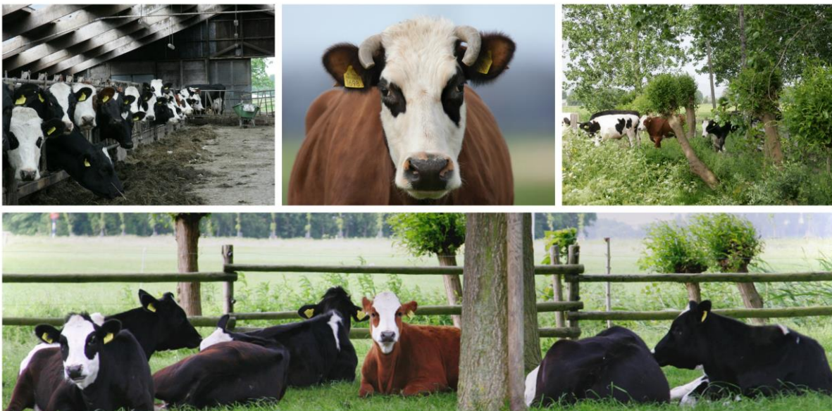
Figuur 6 Blaarkoppen op het bedrijf van mts. Barkema

Het natuurlijke akkerbeheer in combinatie met integraal beweid grasland zal de veldleeuweriken, graspiepers, kwartels, en gele kwikstaarten bedienen. Deze vogels kunnen nu vanuit het kerngebied de aanvullende agrarische natuurstroken bij de collega-boeren bereiken. Het agrarisch natuurbeheer in de directe omgeving zal daardoor robuuster zijn, en op langere termijn meer succesvol. Met hun fraaie dubbeldoel blaarkop koeien hebben Ben en Armgard ook het vee om weidevogel- en akkerbeheer tot een succes te maken. Van oudsher namelijk, liepen de blaarkoppen op de gemengde Groningse boerenbedrijven met weides en akkerland. Blaarkoppen zijn van nature rustige en gemoedelijke koeien. Ze hebben een vriendelijk karakter en zijn daarmee goed te benaderen. Ze hebben voldoende aan een sober rantsoen en kunnen vet worden van wat de natuur hen te bieden heeft. Deze eigenschappen maakt ze uiterst geschikt voor begrazing in openbare natuurgebieden. Planologisch zijn er meerdere raakvlakken om natuur op de kavel G38 te willen realiseren. De naast gelegen Noordertocht is aangewezen als ecologische verbindingszone, De vele natuurvriendelijke oevers in combinatie met brede , extensieve stroken bieden vogels en insecten nu al de ruimte. Het land is begrensd als weide- en als akkervogelbeheergebied. Het IJsselmeer is aangewezen als Natura 2000 gebied.