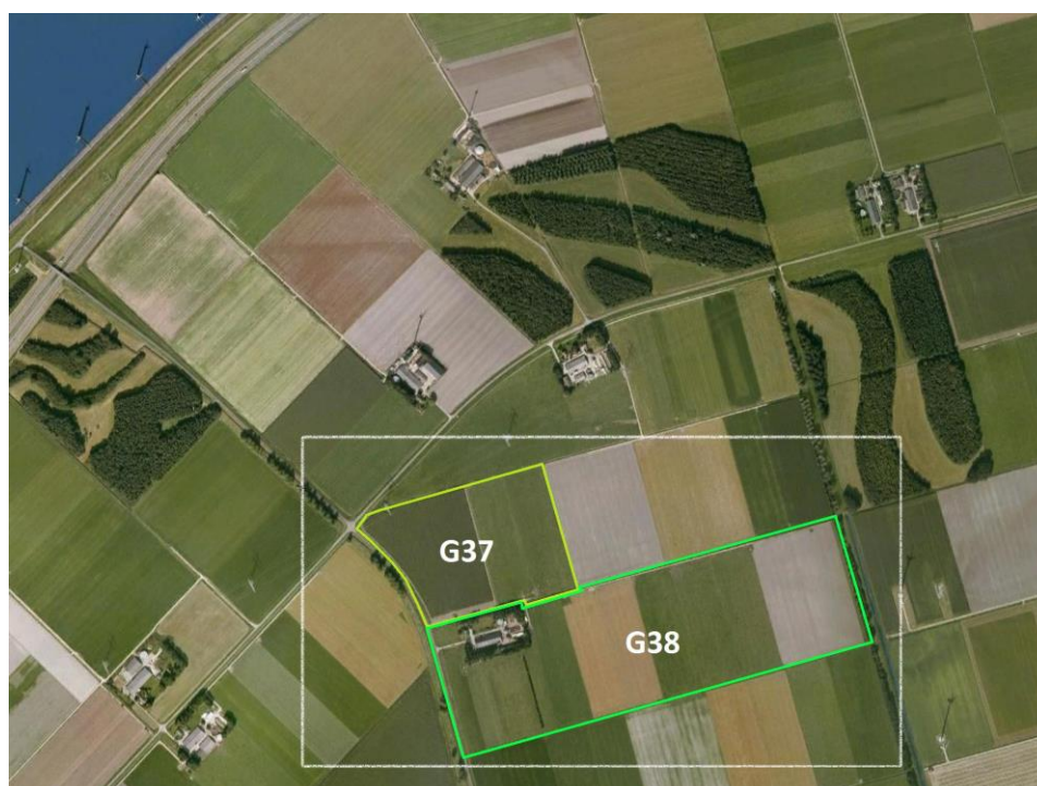
Figuur 2 Locatie Hoeve G38 (op de kaart zijn kavel G37 en G38 aangegeven).

In hoofdstuk 3 worden de financiële aspecten van de realisatie van een Natuurboerderij verder uitgewerkt. Met 4 % van de beschikbare “Oostvaarderswold hectares” versterken we het Rivierduingebied als thuis voor de akker- en weidevogels en verblijvende trekvogels.