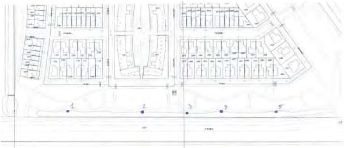
Figuur 2: Vijf verbredingen die iets verdiept zijn en waar een zanddek van 50 cm is aangebracht.

Bij het ontwerp is zand ingebracht op de een vijftal plaatsen in de oever (figuur 2). Dit zand verdwijnt naar verloop van tijd uit de oever. Jaarlijks wordt geïnspecteerd of de zandlaag in het veld nog goed herkenbaar is en voor de rugstreeppad als verblijfplaats voldoet. Op basis van de bevindingen in het veld adviseert een ter zake deskundige op het gebied van rugstreeppadden hoe de situatie geoptimaliseerd kan worden. De gemeente is verantwoordelijk voor de uitvoer van dit advies.