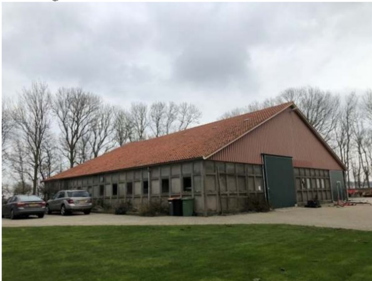
Te renoveren bijgebouw voorzijde