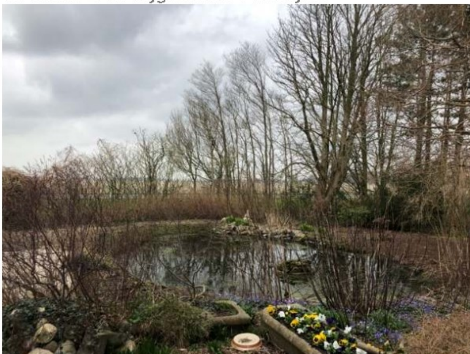
Vijver liggend ten noorden van de planlocatie