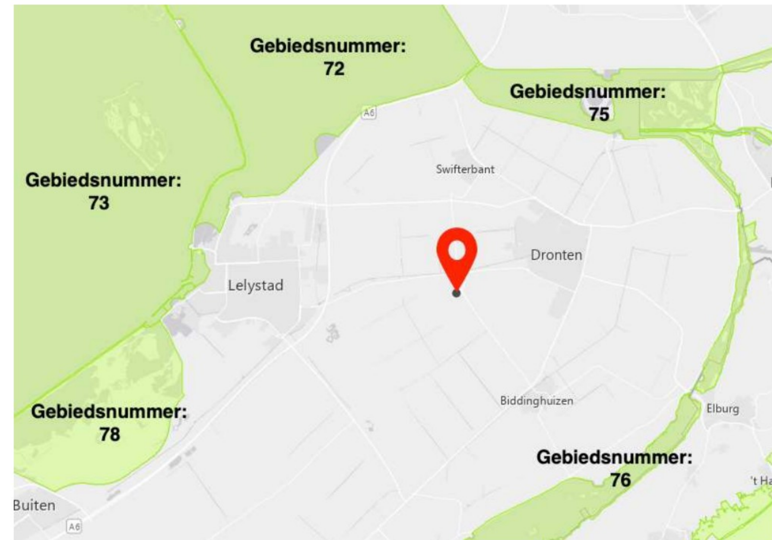
Afbeelding 3. Locatie plangebied (rood) N2000 (groen)