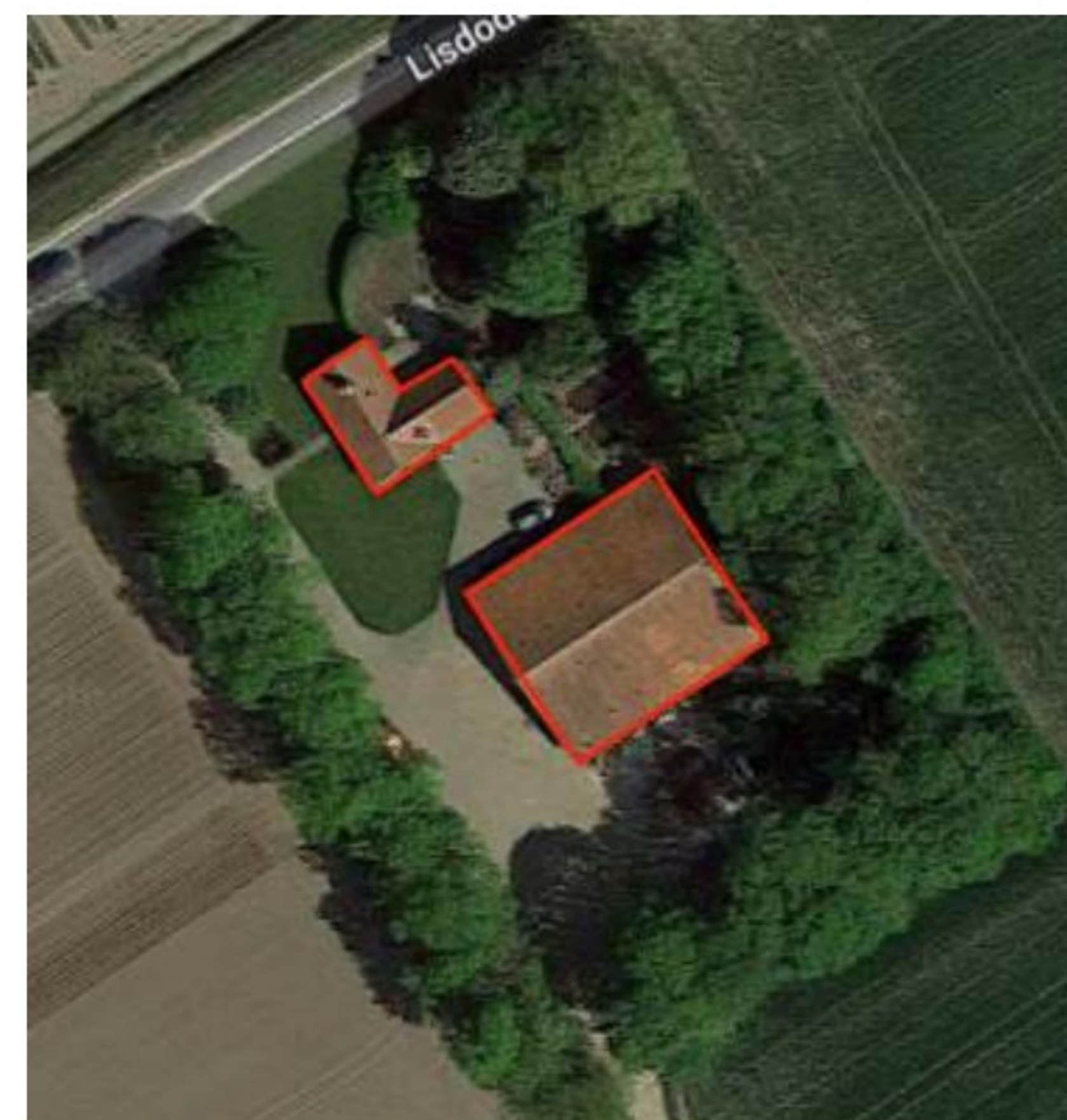
Afbeelding 1&2. Locatie plangebied (rood) (Google, z.d.) (Pdok, z.d.)