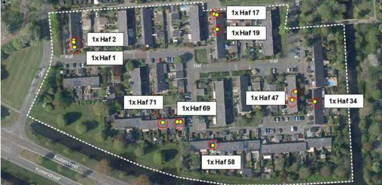
Bijlage 2: Locaties waar nesten van mussen zijn aangetroffen, 9 nesten totaal